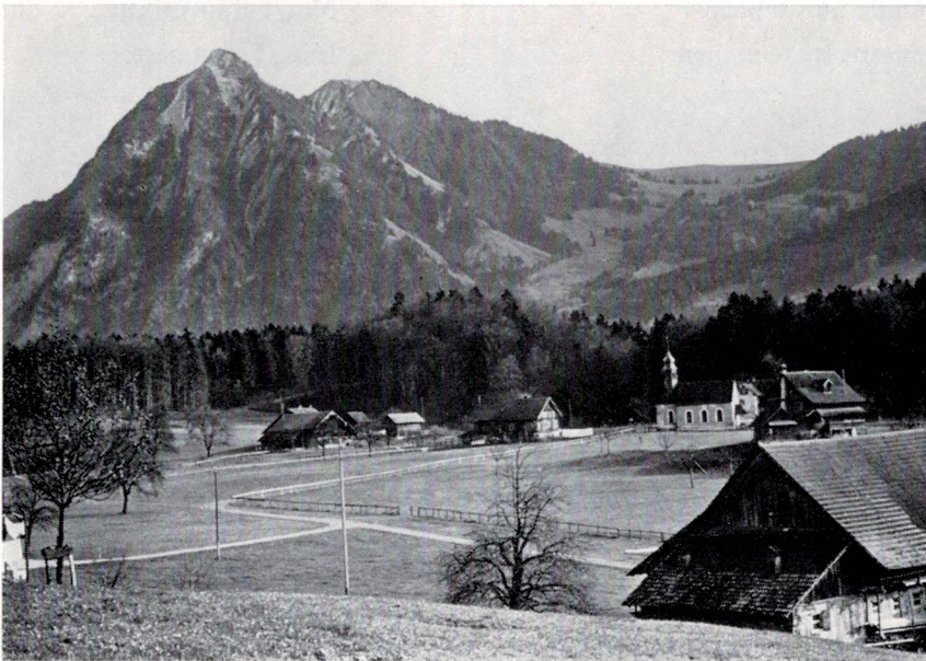
Die einsame Landschaft von Siebeneich mit der Kapelle «Maria-Pötsch». Im Hintergrund der Kernwald und das Stanserhorn mit dem Aecherli.